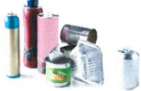
Emballages métalliques : (canettes, barquettes, conserves...)