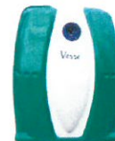
P.A.V. rue de l'Église (à côté du cimetière)