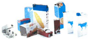
Cartonnettes - briques alimentaires boîtes à œufs en carton