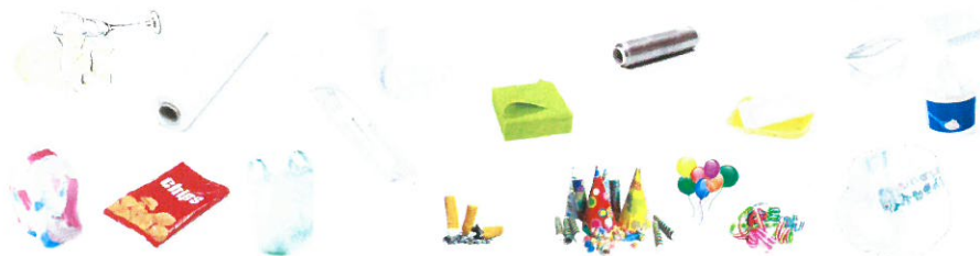
Vaisselle cassée, nappe jetable, vaisselle jetable, serviettes en papier colorées, film alimentaire, barquettes et pots plastiques, barquettes polystyrènes, sachets et sacs plastiques, mégots froids, cotillons, ballons, bolduc, couches culottes et tout ce qui n'est pas recyclable.