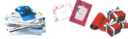
Papiers : journaux, magazines, programmes, enveloppes, cartons d'invitation, menus, faire part, papier cadeaux non plastifié, ...